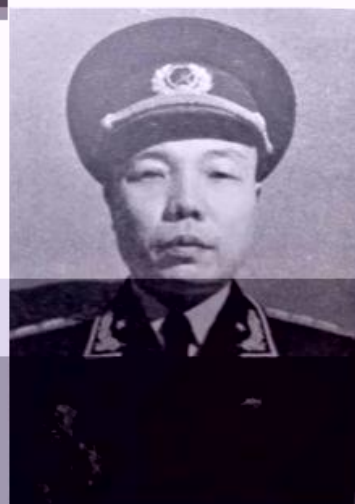
1938年九月，为进一步开辟巩固华北抗日根据地，遵照党中央、毛主席的战略部署，年仅22岁的八路军115师政治部副主任兼343旅政委肖华，率领机关一部300余人组

成八路军东进抗日挺进纵队，开赴素有“小延安”之称的冀鲁边区开展工作，他们一边抗日锄奸，一边发动群众，把边区工作搞得如火如荼。