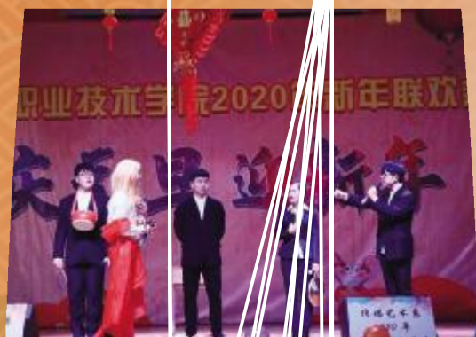
▲传艺系“三句半”——时代国音