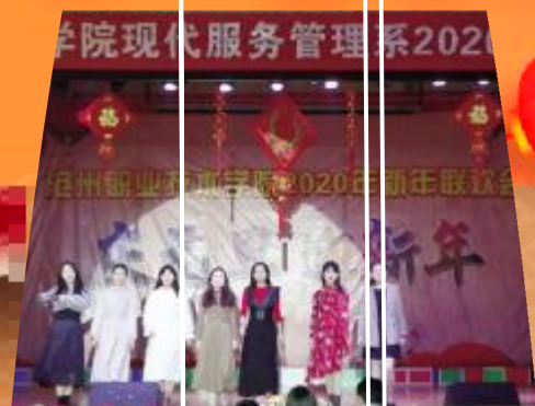
▲现代服务管理系青年教师风采