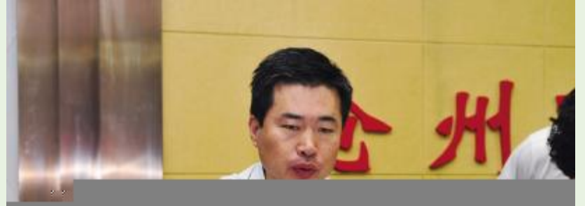
Q R S O 1 T U V W X Y