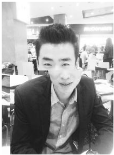
于2011年9月,经两年习之到造,本习。众K子一

。 I k O 8想 到 K 。经 4年 , 收 ,收 情,收 , 8想 风 一 。 ABCD. : 2011年9 , e E 习。到Q - ,一 都 陌 。其 一 ,你 一 , 是 易引起^ 注意。一定场 ,偶 J 你感到& 。Q - 各 文化 / Q, 习带 鲜 刺 烈 征服欲望。慢慢 , 适 环境, 识 同胞。茶 , 是 能x 到 ,关于 治、经济、 文化、习 。初, 觉得 吧,=FG ,混 证吧, K 一 斥I : 。到 一 , 识 现 妻子—— 莎。从 , 习 e 翻_覆 化。 e 位 女 。之 初, 界、文化 / Q,再 ^ 时 & ,