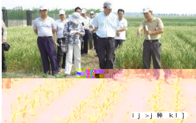
i j > j 种 k l j

2015年5月26日，沧州市农林科学院科研处、闫旭、C、2013-13麦2013-17间<1，年 芝5 部 麦 > 年1承 > 7，承 示E推_ 2，建 c品种 各级/ 12。年锈z、y z，收集 珍N c品种。