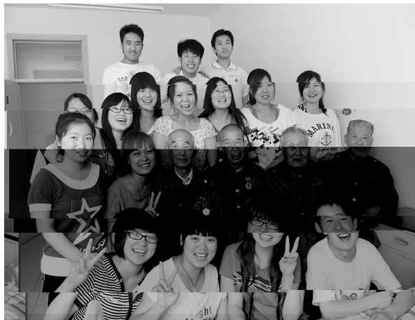
会审 0901 班